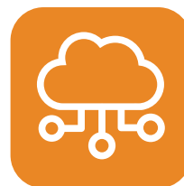
VIRTUALIZZAZIONE E CLOUD