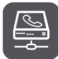
CONNETTIVITÀ E VOIP